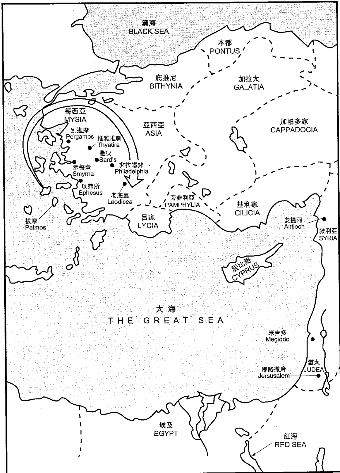
取自詹遜著，《新約精覽》（香港：宣道，1999），頁 465。