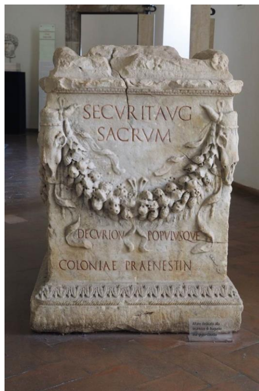
Photo by author, from Museo Archeologico Nazionale, Palestrini, Italy.

3.1.1.1. The benefaction of pax et securitas （參帖前五 3，「平安穩妥」）， Pax Romana .